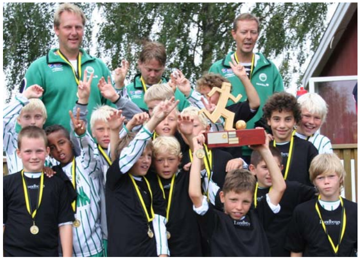
V:a Frölunda Tigrar vann cupen förra året efter att ha besegrat IFK Kumla i finalen.