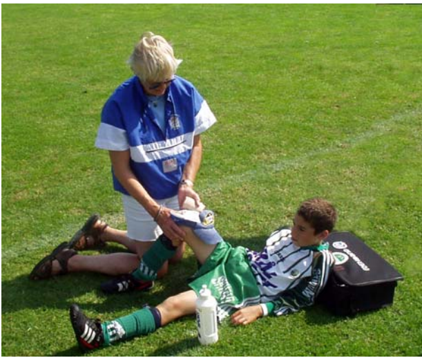
Skador kan tyvärr inträffa, därför har vi sjukvårdare på plats. Här plåstras en Frölundakille om