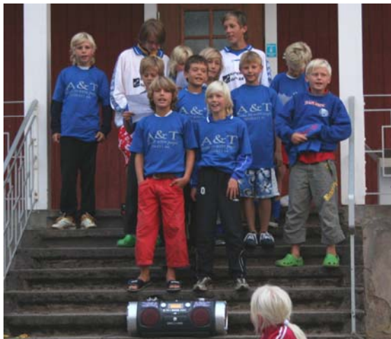
Onsala BK vann kampsångtävlingen

Deltagaravgiften skall vara oss tillhanda 1 juni 2006. Inbetalningskort kommer med det utskick som ni får när ni anmält er, detta innehåller också mer detaljerad information om cupen.