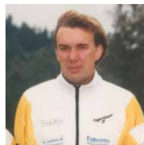
Vi hittade "Bard" på ett kort från 1991